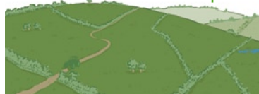
Haies et prés