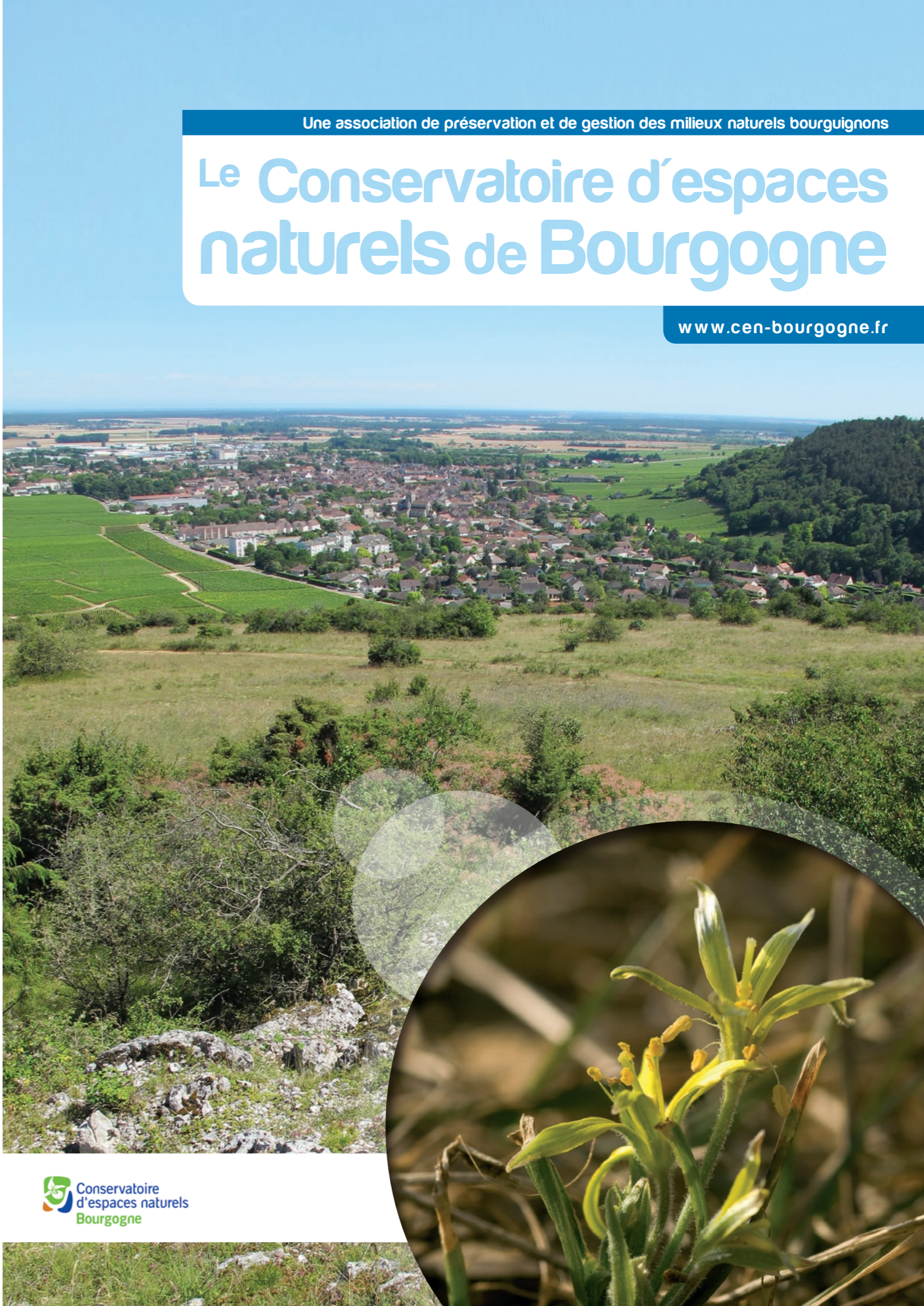
Photos couverture : Pelouses des Damodés à Nuits-Saint-Georges - G. Doucet - CENB • Gagée des champs - C. Foutel - CENB