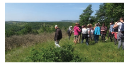
A. Poirel - CENB