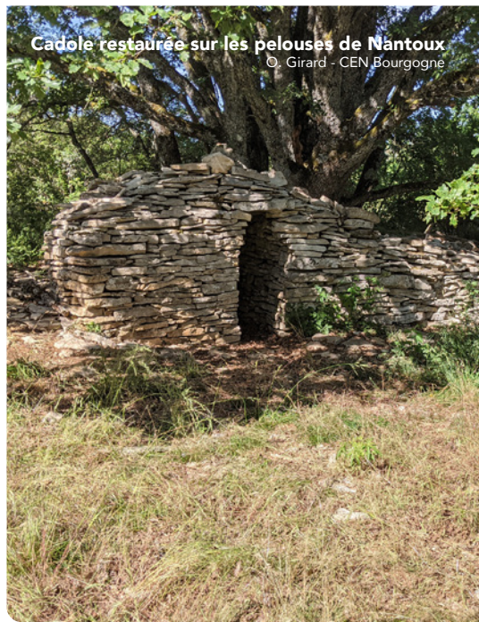
Cadole restaurée sur les pelouses de Nantoux