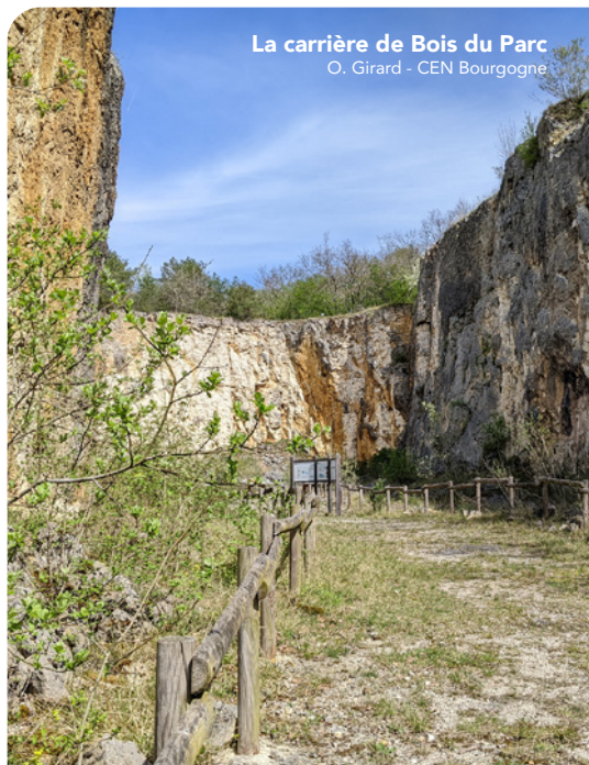
La carrière de Bois du Parc

Conservatoire d'espaces naturels Bourgogne