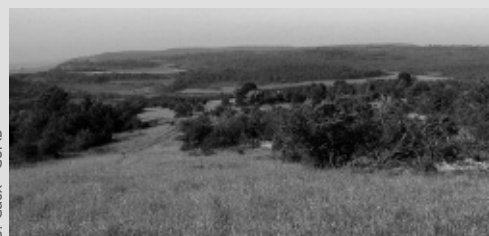
La pelouse calcaire de Nantoux

Cette année, un plan de gestion a été élaboré. Il vise à établir un diagnostic écologique du site, et à proposer des mesures de gestion pour les cinq années à venir. Aussi, un bilan général a tout d'abord été dressé. Il intègre des données relatives aux milieux et à la flore, aux oiseaux, aux papillons, aux reptiles... mais il vise aussi à analyser le fonctionnement écologique global du site, et à évaluer son intérêt patrimonial et son état de conservation. Sur ce point, le bilan est plutôt positif, on trouve sur ce site de vaste surface de pelouses et de fruticées préservées et des espèces rares ou typiques de ces milieux.