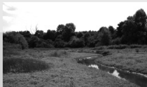
Queue de l'étang Moutiers

La notice de gestion de l'étang Moutiers (2) réalisé en partenariat avec la LPO Yonne a été présentée aux différentes structures concernées par cet étang en décembre 2008. Elle a insisté sur le rôle important des habitats naturels de la queue d'étang en faveur de la biodiversité. Cette année, ce travail se concrétisera par la mise en place d'un partenariat éventuel entre Voies Navigables de France, la LPO Yonne et le Conservatoire ainsi que par un travail en commun avec la Société de pêche locale.