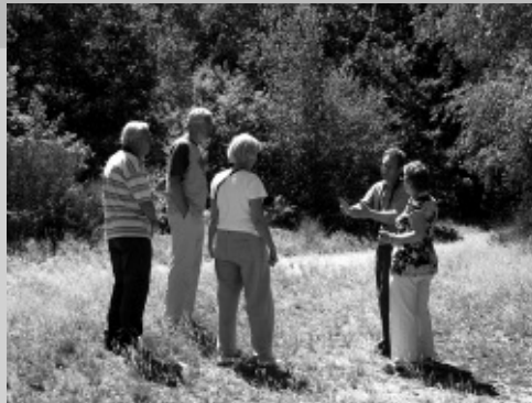
M. Paris - CSNB

Concrètement, l'occasion fut donnée de traduire la plaquette de la