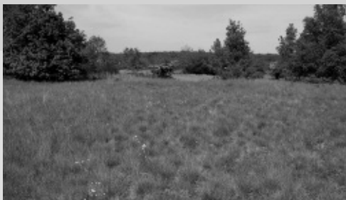
S. Gomez - CSNB

2008 est la première année de mise en œuvre du plan de gestion de cette toute récente Réserve Naturelle Nationale en Bourgogne (6). Faisant suite à la co-rédaction du plan de gestion, le Conservatoire a eu en charge un nombre important d'études botanique et phytosociologique sur des habitats à enjeux forts (éboulis, pelouses sur dalles, marais temporaire du Plan des Essayotes...)