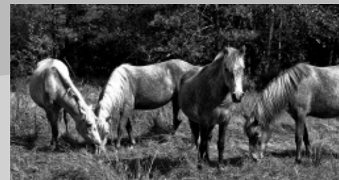
Des expérimentations en cours

vertures ponctuelles de la végétation sont favorables aux espèces pionnières. Le calendrier et la pression de chargement conventionnés avec un éleveur semblent adaptés. En revanche, le secteur le plus haut est fortement colonisé par la Bourdaine. Les chevaux la consomment peu et il faudra donc probablement mettre en place un débroussaillage adapté sur ce site prochainement.