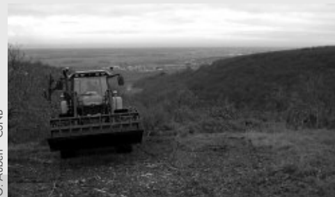
G. Aubert - CSNB

Nous avons tout d'abord finalisés les travaux de restauration de la pelouse de la Taupe à Chambolle-Musigny (8). Ces travaux avaient été entamés en fin d'année 2009. À l'aide de tronçonneuses et d'un broyeur, le site a retrouvé une seconde jeunesse !