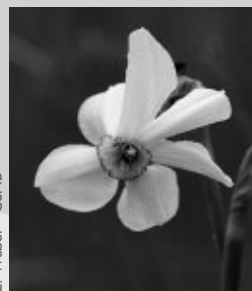
Narcisse des poètes

En parallèle, deux expertises écologiques ont été lancées sur des zones humides remarquables à l'échelle du bassin. Elles concernent le secteur des sources de la Groème à Terrefondrée et une zone humide remarquable sur le sous bassin du Revinson. Des espèces remarquables ont déjà été recensées par les premiers passages sur les zones humides avec la présence du Sonneur à ventre jaune, du Scirpe comprimé et du Narcisse des poètes !