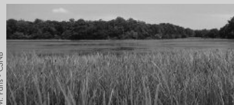
M. Paris - CSNB

Dans le cadre du plan de gestion écologique de l'étang de la Noue (71), un suivi de la flore des berges et de la faune (odonates et papillons de jour) a été réalisé.