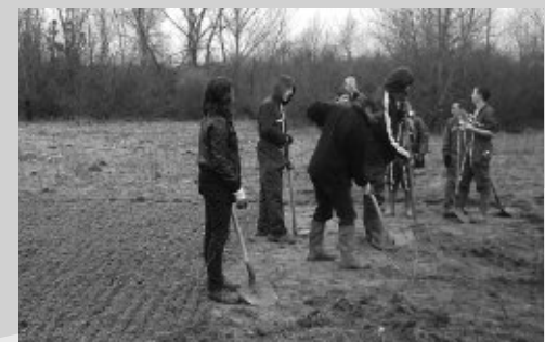
C. Neyer / RNVL - CNRNC

Dans la foulée et sur le même site, les associations de chasseurs à l'arc, intervenants par ailleurs sur la réserve naturelle pour contribuer à la dispersion et à la régulation des sangliers surabondants, sont venues prêter main forte pour leur journée annuelle de participation à la gestion de la réserve naturelle.