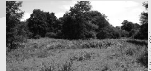
Les Boullins (3) : un nouveau site, co-géré par la Ligue pour la Protection des Oiseaux de l'Yonne (LPO89) et le Conservatoire

Ces parcelles situées en Puisaye, achetées en 1995 par le Conservatoire, avaient déjà fait l'objet d'un plan de gestion en 1997, ainsi qu'une étude phytosociologique en 1995 et 2003. Entre temps, le milieu a évolué. Ainsi, cette année est l'occasion d'une nouvelle analyse complète de l'ensemble des formations végétales et la rédaction d'un nouveau plan de gestion de ce milieu prairial jusqu'alors pâturé extensivement par des Koniks Polskis.