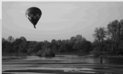
Tournage en Cinébulle au dessus de la réserve naturelle

La Réserve Naturelle Nationale du Val de Loire a été retenue comme le lieu de tournage pour illustrer La Loire dans l'épisode sur les fleuves. Le personnel de la réserve accueille et guide ce printemps l'équipe de tournage sur différents sites de la réserve naturelle.