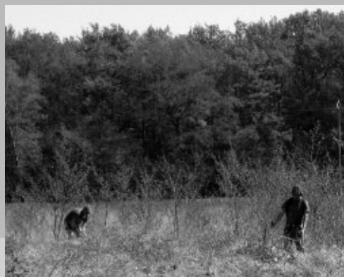
G. Aubert - CSNB

Débroussaillage sur site - G. Aubert - CSNB