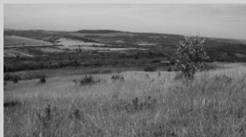
Pelouse de la Montagne des Trois croix

La partie diagnostic du plan de gestion de la Montagne des Trois Croix est en cours d'élaboration. Ainsi, les paragraphes relatifs aux informations générales, aux contextes physique et socio-économique sont en cours de finalisation. Des inventaires naturalistes de terrain sont actuellement menés et permettront d'établir le diagnostic écologique sur lequel les mesures de gestion s'appuieront.