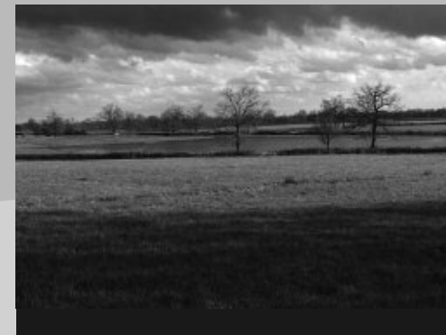
Prairie inondable le long de la Loire amont

sur 16,91 ha dans le but de reconquérir des habitats d'intérêt européen envahis par une fruticée trop dynamique.