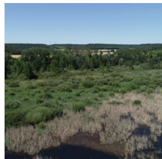
Roselière et marais vus du ciel CD21