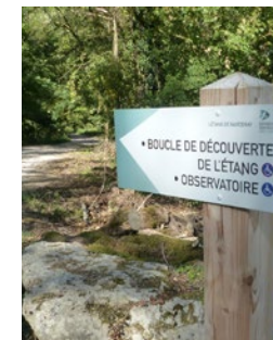
Balisage du sentier O. Girard - CENB

Distance : 4 km Durée de cheminement : 1h30 min Difficulté : Facile