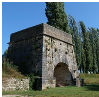
Haut fourneau O. Girard - CENB