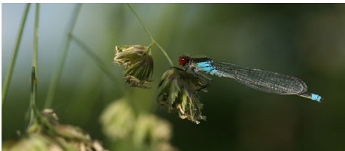
Naiade aux yeux rouges bien visible au-dessus de l'étang en juin et juillet