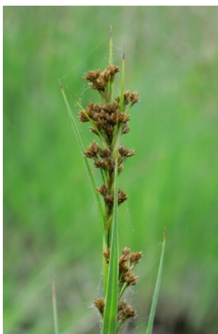
Marisque en voie de disparition en Côte-d'Or