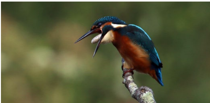
Martin pêcheur d'Europe régurgitant une pelote contenant des écailles et arêtes de poissons