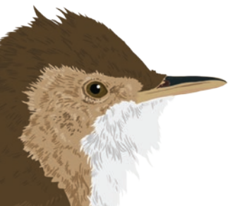
Rousserolle effarvate

Sa vaste roselière , une des plus étendues de Côte-d'Or, accueille, quelle que soit la saison, quantité d'oiseaux dont certains menacés. Sa végétation aquatique est riche et diversifiée et constitue pour les poissons mais aussi pour bien des insectes de véritables nurseries ! Caché derrière la frange boisée qui ceinture l'étang, un marais tufeux abrite plusieurs espèces végétales devenues extrêmement rares en Côte-d'Or.