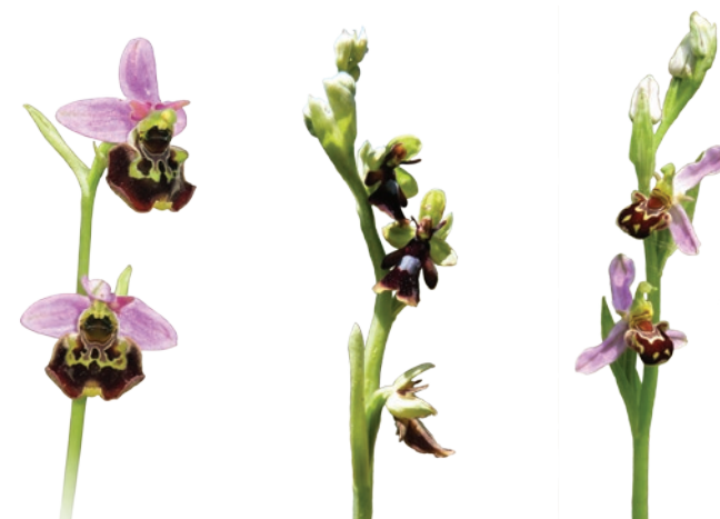
Ophrys bourdon, Ophrys mouche et Ophrys abeille O. Girard, G. Doucet - CENB

Ces deux sites ne sont séparés que par 2 km de sentiers balisés. Pour les plus courageux, il est possible de faire à pied une grande balade d'une dizaine de kilomètres qui emprunte notamment ces deux petites boucles. Pour en savoir plus, regardez la carte ci-contre (Tracé de couleur violette en pointillé). Balisage de chemins de randonnée GR7 et PR.