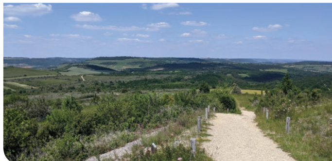
La Montagne des Trois croix

Ces trois croix se dressant dans le ciel attirent les curieux. Au-delà des vignes qui font la renommée de Santenay et Dezize-lès-Maranges, ce mont offre bien d'autres curiosités. Vous pourrez y observer des fleurs aux capacités remarquables aussi bien susceptibles de pousser sur des sols très caillouteux que de mimer le corps d'un insecte.