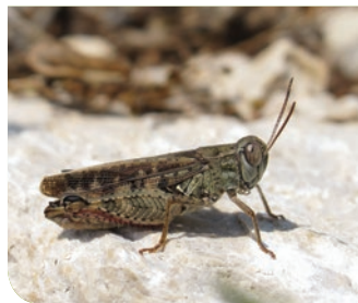
Criquet italien G. Doucet - CENB