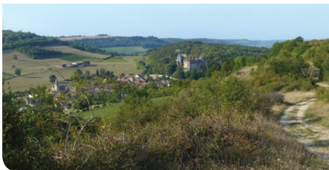
Le château de la Rochepot vu depuis La Chaume O. Girard - CENB

Trente cinq hectares de pelouses calcaires surplombent le village de La Rochepot. Ces chaumes abritent quantité d'oiseaux, dont certains sont rares, et une végétation aux airs de Méditerranée.