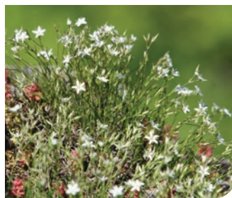
Minuartie à rostre CENB