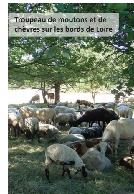
Troupeau de moutons et de chèvres sur les bords de Loire

Les éleveurs et leurs troupeaux permettent le maintien et la réouverture des bords de Loire, milieux fragiles et enclins à être peu à peu remplacés par des milieux plus pauvres en termes d'accueil pour la biodiversité (ronciers, fruticées, etc.). Le pâturage participe aussi à la diversité paysagère, à la diversité floristique et au retour de la flore patrimoniale.