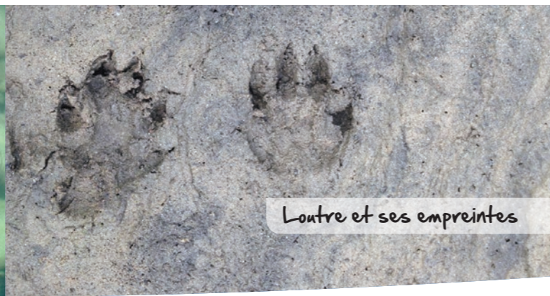
Loutre et ses empreintes

Petit mustélide discret, la Loutre d'Europe, que nous surnomons affectueusement Lulu, a tout pour nous séduire avec sa petite bouille moustachue. En 2018, elle a été de nouveau aperçue sur le site Natura 2000.