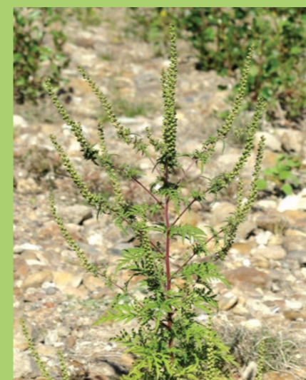
L'Ambrosie à feuilles d'armoise

De nombreuses plantes invasives ont colonisé les bords de Loire. Parmi elles, voici les deux principales espèces à surveiller.