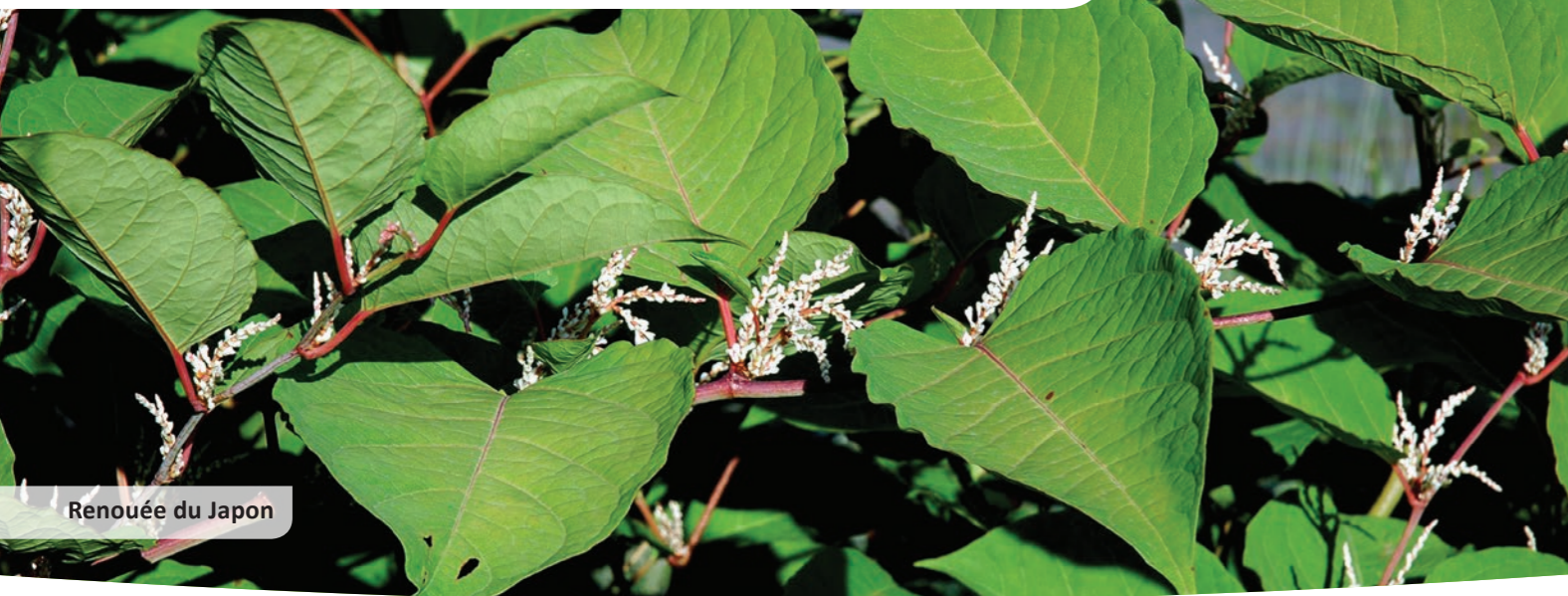
Renouée du Japon

Les plantes invasives sont des espèces dites exotiques, c'est-à-dire introduites volontairement ou non dans une terre étrangère à leur milieu d'origine, qui prolifèrent dans un espace naturel au détriment de la biodiversité locale, qu'elles peuvent complètement éliminer. Cette dynamique s'explique par leur capacité à coloniser rapidement une zone et par l'absence de leurs prédateurs habituels.