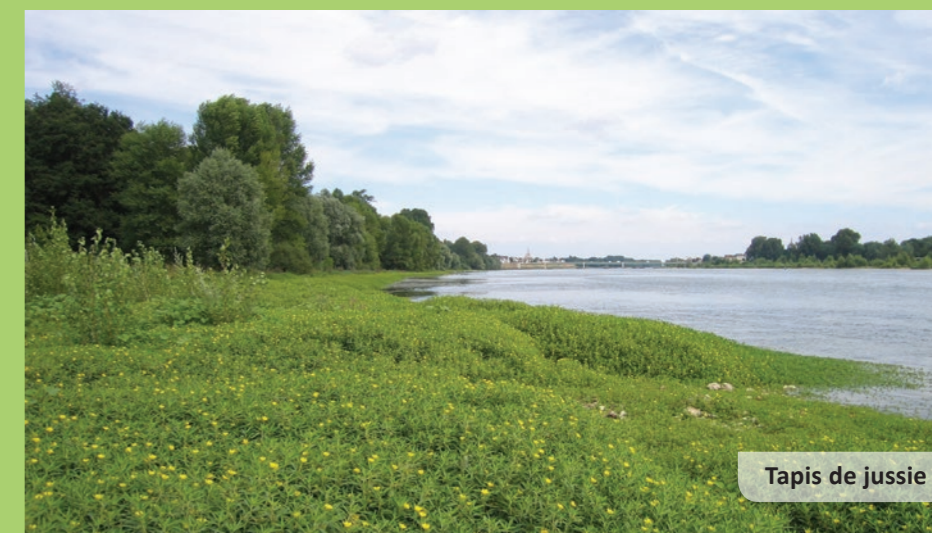
Tapis de jussie

Aussi appelée « Herbe de la Saint-Jean », cette plante peut atteindre 2 m de haut. Sa tige est couverte de poils blancs. Ses fleurs, nombreuses, petites, vertes puis jaunâtres à maturité, produisent de juillet à octobre un pollen allergisant , auquel 6 à 12 % de la population française seraient sensibles. Les semences d'ambrosie se retrouvent dans les sachets de graines pour oiseaux . Ainsi, l'ambrosie se répand peu à peu dans les milieux naturels.