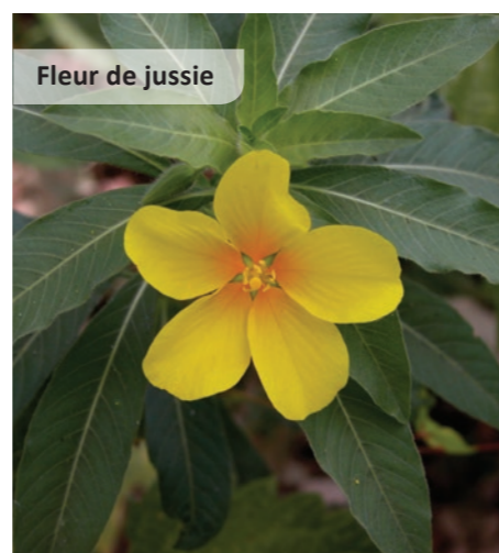
Fleur de jussie

Le cas le plus connu et le plus problématique est celui de l'ambrosie, dont le pollen est fortement allergisant.