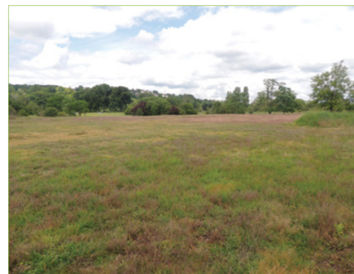
Un projet d'entretien des milieux ouverts par pâturage est en cours de montage sur le sentier du Ver-Vert à Nevers