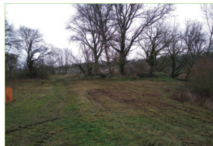
Les premiers travaux réalisés durant l'hiver 2020 sur l'île du Faubourg ont consisté en un broyage de la strate herbacée puis à l'export de la végétation

La Charité-sur-Loire porte un contrat Natura 2000 qui lui permet de financer en grande partie la restauration et l'entretien de milieux naturels remarquables sur l'île du Faubourg. Les premiers travaux ont débuté en mars 2020 et se poursuivront jusqu'en 2022.