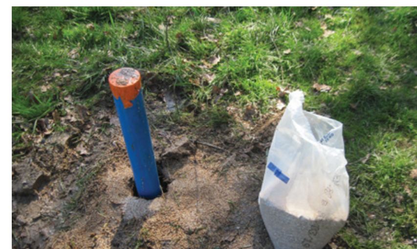
Piezomètre installé à proximité d'une boire sur la commune de Challuy