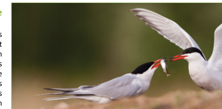
La Sterne Pierregarin, l'une des deux espèces de Sternes qui niche sur l'île aux Sternes à Nevers

Anne Wozniak : L'île aux sternes, site majeur de reproduction de deux espèces de sternes protégées, fait l'objet d'un arrêté préfectoral et d'un suivi avec la LPO (Ligue pour la Protection des Oiseaux). Il concentre en période d'occupation 10 % de la population de sternes au niveau national, 90 % au niveau départemental (source LPO Nièvre). La ville participe à cette préservation en installant la signalétique réglementaire et pédagogique. La police municipale joue un rôle important de surveillance et de sensibilisation pendant toute la période de Nevers plage. Le service communication prolonge ce travail d'information et de sensibilisation auprès du public.