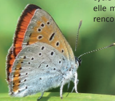
Cuivré des marais

Espèces patrimoniales : 35 d'oiseaux 9 d'insectes 1 de mollusque 10 de poissons 7 de mammifères 2 d'amphibiens 1 de reptile 1 de plante