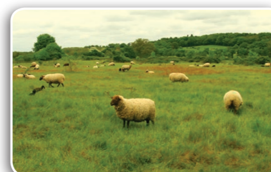
Troupeau de brebis et d'agneaux pâturant sur le site des Brocs

Ces suivis sont complétés par de nombreux échanges techniques avec l'éleveur pour adapter le pâturage d'année en année.