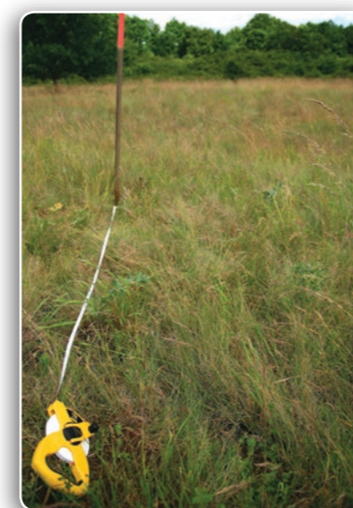
Placette de suivis scientifiques sur une pelouse à Fétuque à longues feuilles