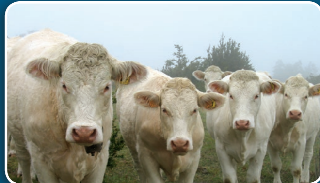
R. Vuillemin - CENB

Sur Loire-Allier, les Charolaises représentent l'essentiel du cheptel ruminant. Les éleveurs marquent le territoire de par le maintien de surface en herbe gérée de manière extensive dans les vals d'Allier et de Loire.