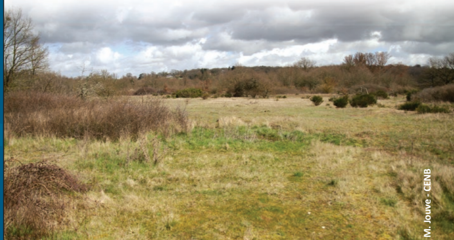
M. Jouve - CENB

Les actions pourront être engagées par le contractant ou déléguées à un tiers dans le respect des cahiers des charges.