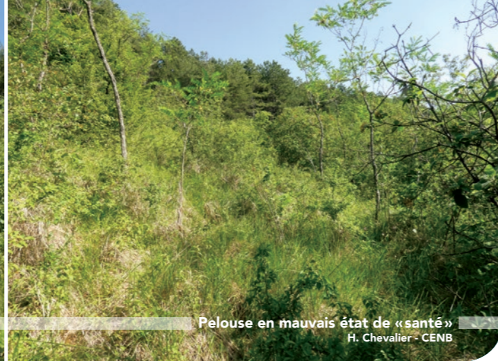
Pelouse en mauvais état de «santé» H. Chevalier - CENB