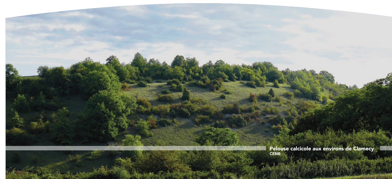
Pelouse calcaïque aux environs de Clamecy CENB

Imprimé en novembre 2020 par S'Print à 700 exemplaires