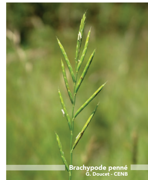
Brachypode penné G. Doucet - CENB

L'état de «santé» moyen des pelouses de Clamecy et de ses environs est évalué à 70/100, ce qui correspond à un état altéré. Par conséquent, il est urgent d'agir pour éviter que la note continue de diminuer dans les prochaines années!