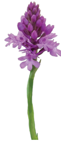
Orchis pyramidalis O. Girard - CENB

Merci de ne pas cueillir les orchidées ! Et inutile de les déterrer pour les replanter dans un jardin ! Exigeantes, elles ont peu de chances de survivre ailleurs que dans leur milieu naturel.