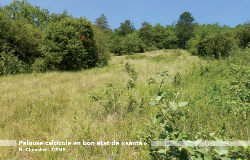
Pelouse calcicole en bon état de «santé»