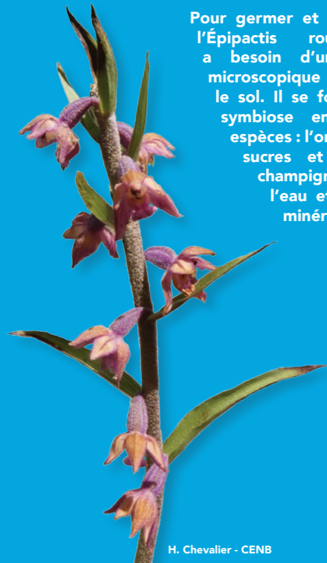
H. Chevalier - CENB

Pour germer et se développer, l'Épipactis rouge noirâtre a besoin d'un champignon microscopique vivant dans le sol. Il se forme alors une symbiose entre les deux espèces : l'orchidée apporte sucres et vitamines au champignon, contre de l'eau et des éléments minéraux.