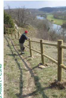
G. Aubert - CSNB

Des barrières bordent maintenant le sentier de découverte.