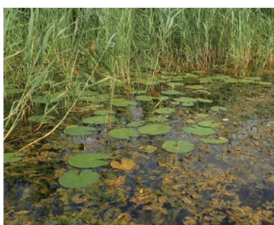
G. Doucet - CENB

L'eau libre et la végétation aquatique qui y est associée occupent plus de la moitié de la surface de l'ENS. Les herbiers aquatiques sont dominés par de nombreuses espèces dont les feuilles restent majoritairement sous l'eau tels les Cornifles , les Myriophylles ou encore des Characées . Sur les secteurs d'eau calme, assez profonde et bien ensoleillée, la végétation aquatique peut prendre la forme de tapis flottants constitués par les grandes feuilles des nénuphars , ou celles plus petites des potamots .