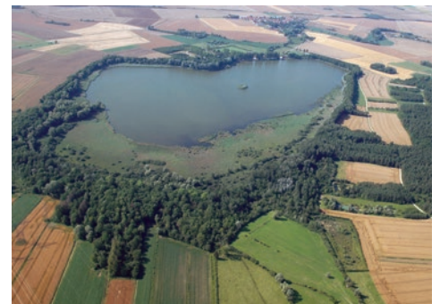
Étang ceinturé de boisement D. Sirugue

Budget prévisionnel : 17 300 € Calendrier prévisionnel : 2018 à 2025