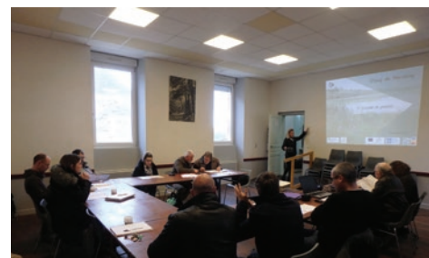
Réunion du comité de gestion

Budget prévisionnel : 69 650 € Calendrier prévisionnel : 2017 à 2026