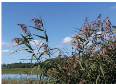
O. Girard - CENB

La vaste roselière constitue une spécificité de la queue de cet étang et présente un grand intérêt en tant qu' habitats d'espèces animales et plus particulièrement d'oiseaux. Elle est majoritairement composée de Roseau commun mais il existe à certains endroits des variantes riches en Massettes ou Rubaniers .