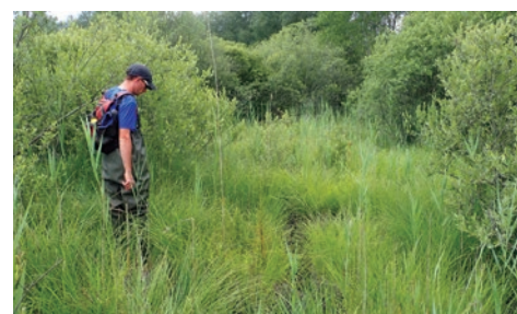
Prospection pour l'inventaire naturaliste du marais

Budget prévisionnel : 48 100 € Calendrier prévisionnel : 2017 à 2026