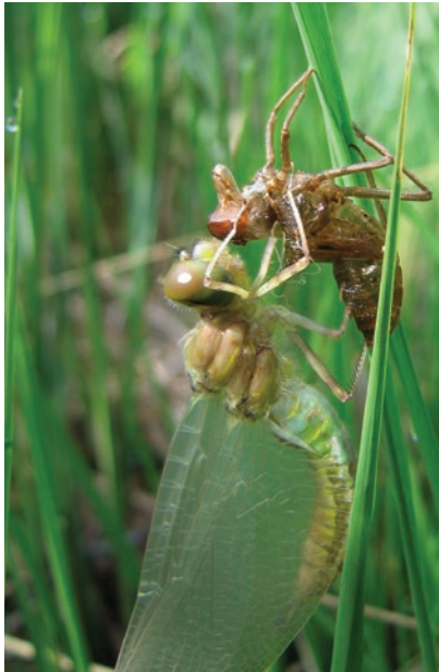
Émergence de Cordulie à taches jaunes G. Doucet - CENB