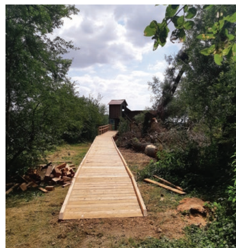
Réfection de l'observatoire

Budget prévisionnel : 98 190 € (Ce budget ne tient pas compte du coût des aménagements de découverte) Calendrier prévisionnel : 2017 à 2026