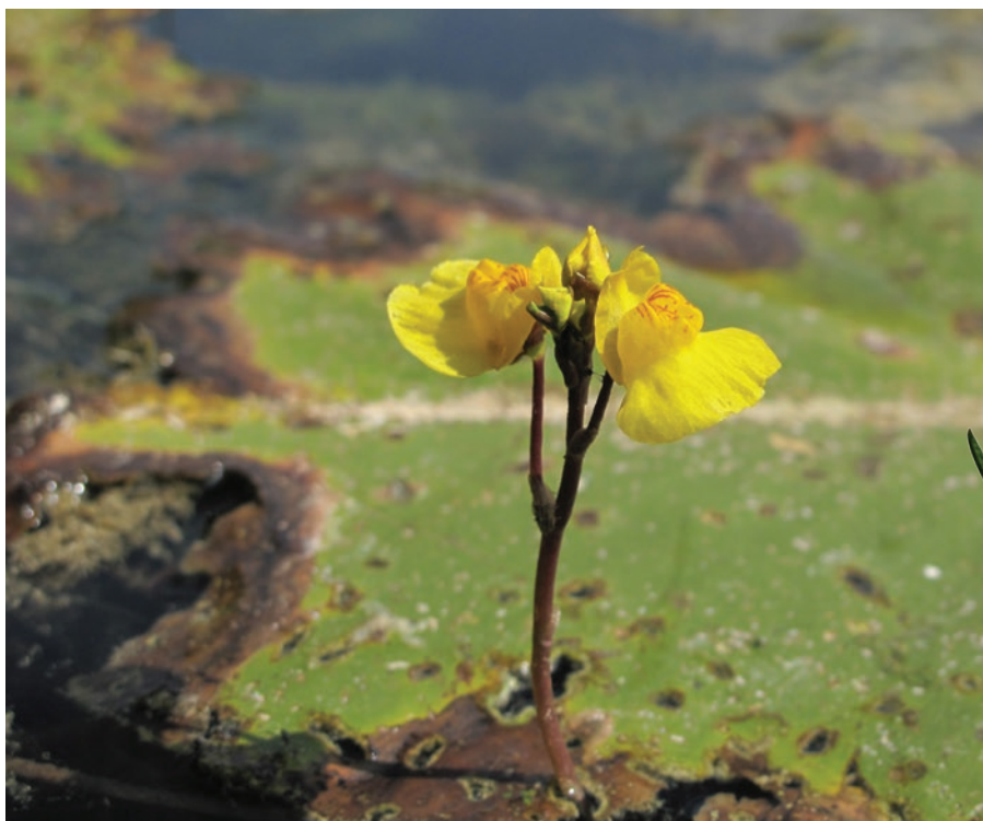
Grande Utriculaire G. Doucet - CENB