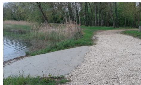
Aménagement d'une mise à l'eau pour les pêcheurs

Budget prévisionnel : 174 660 € Calendrier prévisionnel : 2017 à 2026