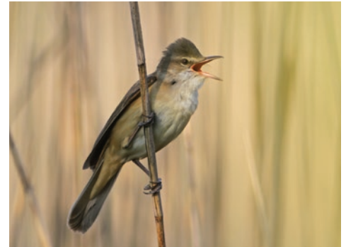
Rousserole turdoïde S. Guillebault