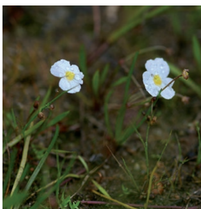
Flûteau fausse-renoncule