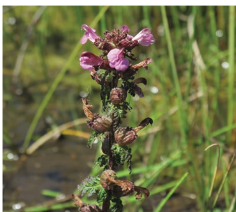
Pédiculaire des marais G. Doucet - CENB