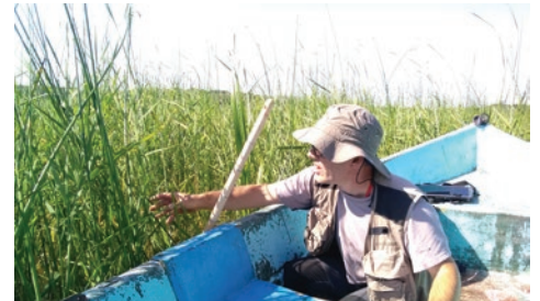
Suivi de la végétation aquatique G. Doucet - CENB

Budget prévisionnel : 168 930 € Calendrier prévisionnel : 2017 à 2026