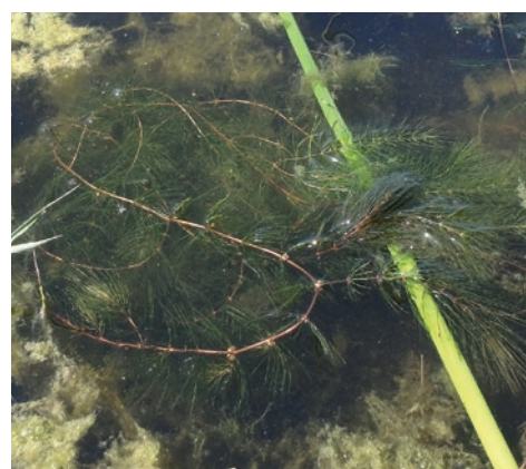
Cornifle submergé G. Doucet - CENB