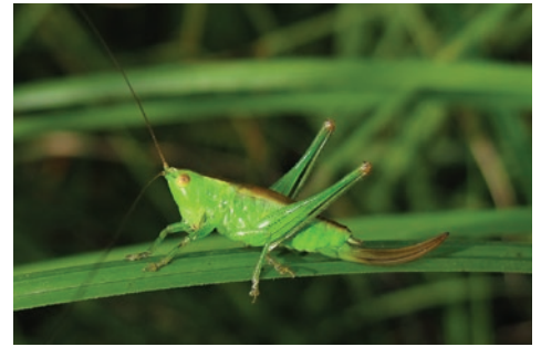
Conocéphale des roseaux

La végétation aquatique, la roselière et la végétation herbacée du marais sont particulièrement propices à l'installation de nombreux insectes et notamment des libellules et demoiselles (odonates) et des criquets et sauterelles (orthoptères). Les odonates sont les mieux connus avec plus de 30 espèces différentes recensées. Si la plupart des espèces sont assez communes, 3 espèces méritent une attention particulière : l' Agrion gracieux , la Leucorrhine à large queue et la Cordulie à taches jaunes . Les connaissances sont moins fournies pour les Orthoptères, mais on peut noter la présence du Conocéphale des roseaux , espèce exigeante quant à la qualité de son habitat.