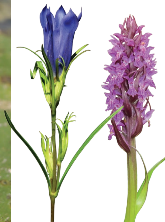
Gentiane pneumonanthe et Orchis incarnat G. Doucet - CENB