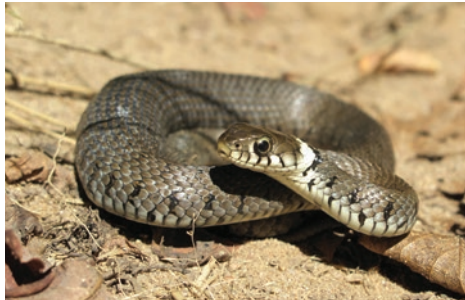
Couleuvre à collier G. Doucet - CENB