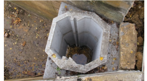
Installation d'un moine, ouvrage de vidange

Budget prévisionnel : 152 950 € Calendrier prévisionnel : 2017 à 2026