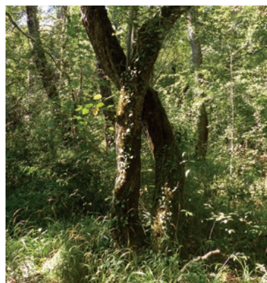
O. Girard - CENB

Des boisements plus ou moins humides constituent une zone de transition entre l'étang à proprement parler et les parcelles adjacentes occupées majoritairement par des cultures. Les Saules blancs, Frênes, Aulnes et Chênes pédonculés sont les principales essences de cette frange boisée qui jouent un rôle de filtre épurateur.