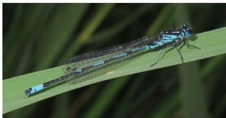
Agrion gracieux G. Doucet - CENB