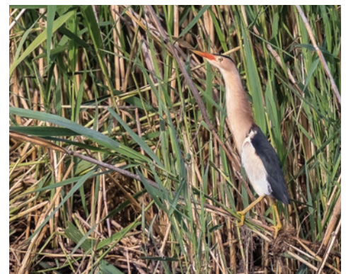
Blongios nain R. Fauvernier

L'étang est largement reconnu pour son intérêt ornithologique . Plus de 180 espèces d'oiseaux le fréquentent en hiver pour « passer la mauvaise saison », en période de reproduction durant la fin du printemps et l'été ou lors des haltes migratoires du printemps et de l'automne. Une vingtaine d'espèces est considérée comme menacée au niveau régional voire national. Le Blongios nain , la Rousserole turdoïde nichent par exemple sur l'étang et de nombreux canards y passent l'hiver. Quelques amphibiens et reptiles sont également présents sur le site, comme la Couleuvre à collier .