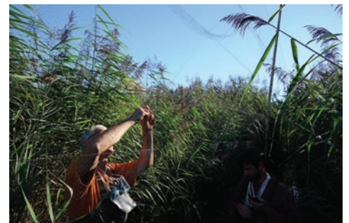
Ornithologue retirant un oiseau du filet de capture lors du camp de baguage

Budget prévisionnel : 323 220 € dont les 2/3 sont destinés au suivi ornithologique avec notamment le camp de baguage annuel réalisé par la LPO Calendrier prévisionnel : 2017 à 2026