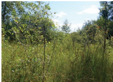
O. Girard - CENB

L'Espace Naturel Sensible (ENS) abrite une mosaïque de milieux aquatiques et humides adaptés à l'abondance du calcaire dans l'eau et le sol. Une part significative de ces milieux est reconnue d'intérêt européen.