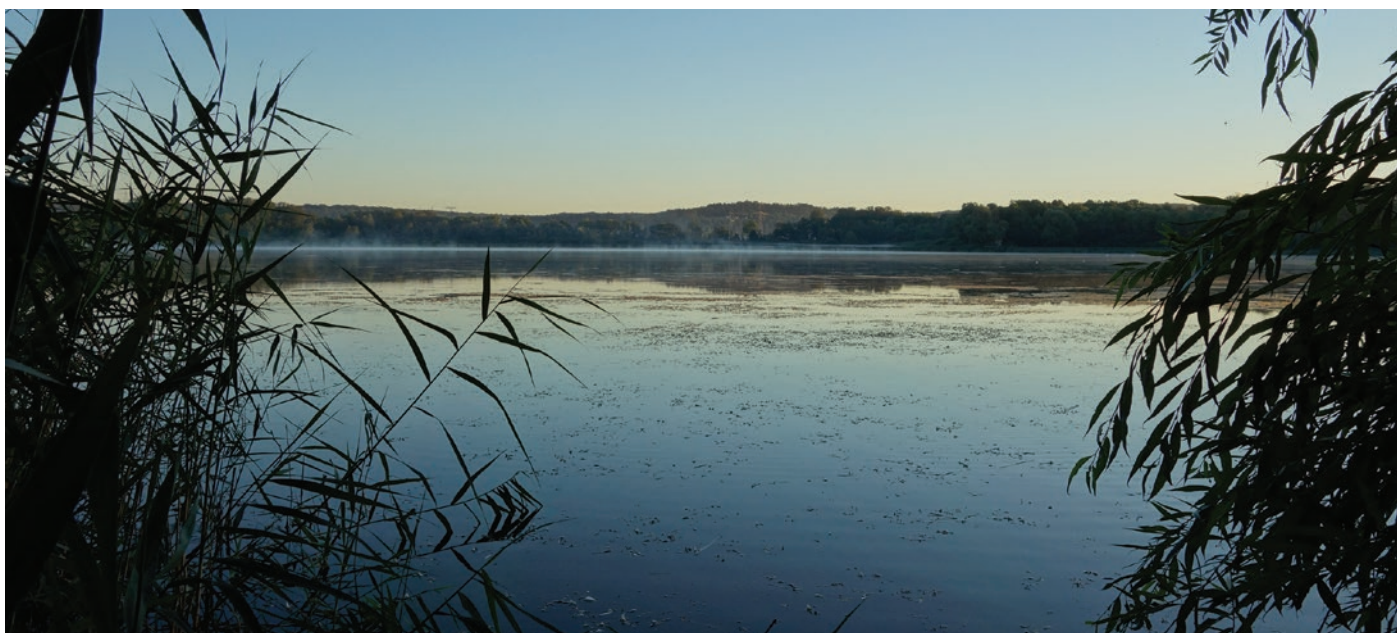
L'étang de Marcenay au petit matin

Depuis décembre 2013, le Conservatoire est agréé par l'État et la Région au titre de l'article L.414-11 du Code de l'environnement. Ainsi, ils reconnaissent l'intérêt de ses actions et affirment leur soutien à l'association.