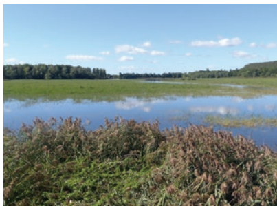
L'étang vu de l'observatoire O. Girard - CENB

L'étang de Marcenay fait figure d' îlot de biodiversité dans un environnement fortement marqué par une intensification des pratiques agricoles et forestières .