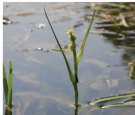
Rubanier nain

Si la végétation aquatique est composée d'espèces assez communes comme les nénuphars , elle recèle aussi d'espèces patrimoniales tels le Cornifle submergé ou encore la Grande Utriculaire .