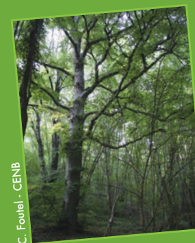
C. Foutel - CENB