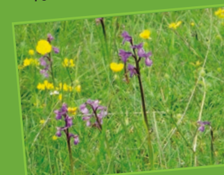
Pelouse à orchidées