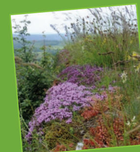
Végétation de corniche

Avant de partir, pensez à consulter la charte du randonneur disponible sur le portail internet