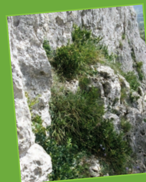
Végétation de falaises