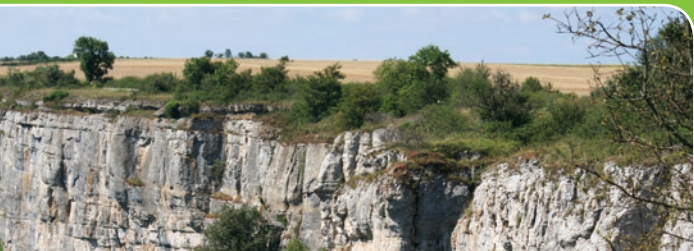
Les falaises de Saint-Romain

Véritable trait d'union entre les Côtes dijonnaises au nord et les Côtes chalonnaises au sud, ce vaste ensemble est caractérisé par son socle calcaire, très filtrant, qui donne naissance à des sols squelettiques peu profonds et particulièrement sujets à la sécheresse.