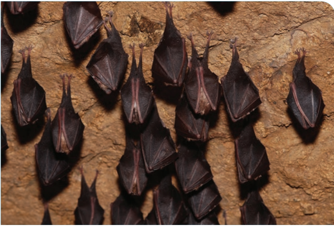
Colonie de Petits rhinolophes