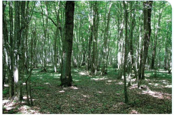
Hêtraie - chênaie de plateau

La destruction de leurs terrains de chasse, la disparition de leurs abris d'hibernation ou de reproduction, le dérangement par les humains, la pollution chimique, entre autres, menacent ces petits mammifères, pourtant protégés à l'échelle nationale.