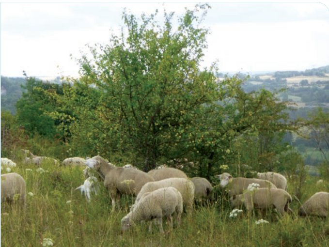
Pâturage par des moutons

Cela permet aux plantes et aux animaux typiques des pelouses calcicoles de continuer à vivre sur ces milieux.