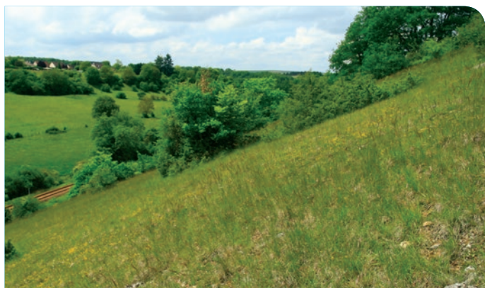
M. Jouve - CENB

Sur l'ensemble du site, les pelouses calcicoles ont régressé et sont globalement en mauvais état de «santé» . L'abandon et le manque «d'entretien» de ces milieux naturels entraînent en effet un embroussaillage important , nuisant au développement des espèces typiques.