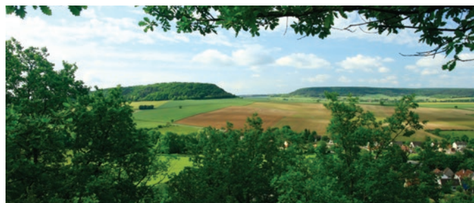
Butte témoin du Mont Breuvois, vue du Bois de la Roche

Ce sont des contrats passés pour 5 ans entre l'État et un agriculteur volontaire pour adopter sur ses parcelles des pratiques respectueuses de la nature. Ce dernier reçoit une contrepartie financière pour compenser les pertes de revenus ou les coûts supplémentaires engendrés.