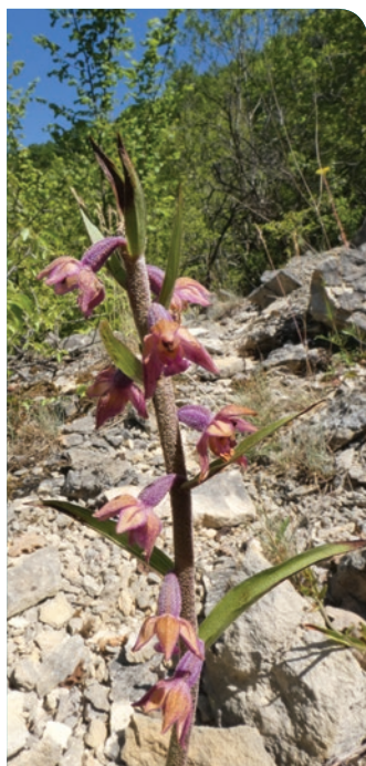
S. Gomez - CENB

Ces milieux à végétation basse , installés sur les buttes témoins et les coteaux calcaires bien exposés au soleil , recèlent une faune et une flore spécifiques , particulièrement riches. Les orchidées en sont certainement les meilleures ambassadrices. Pour ne citer qu'elles, la Céphalanthère rouge et la Limodore à feuilles avortées sont bien présentes sur plusieurs entités.