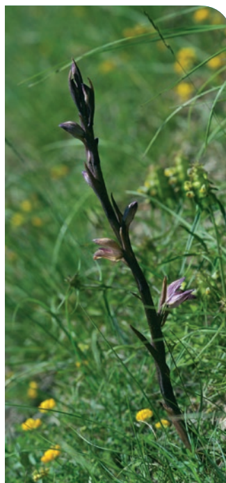
C. Foutrel - CENB