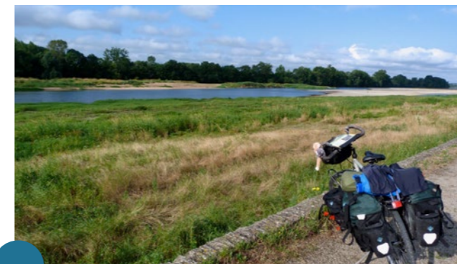
Balade à vélo sur les bords de Loire