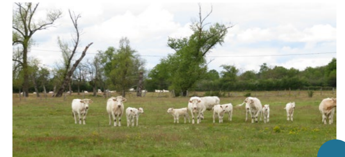
Pâturage sur les prairies ligériennes