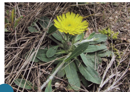
La Piloselle de Loire, espèce endémique

2 110 Grues cendrées ont été comptabilisées en hiver 2016 sur la réserve naturelle contre 46 en 2002.