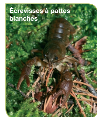
Écrevisses à pattes blanches