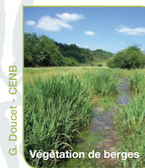
Végétation de berges

Les végétations des berges de cours d'eau constituent le lieu de vie indispensable à de nombreuses espèces d'insectes comme des libellules par exemple.