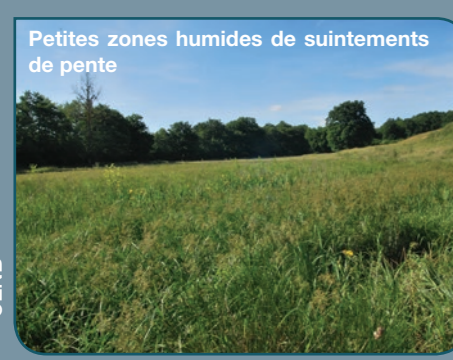
Petites zones humides de suintements de pente