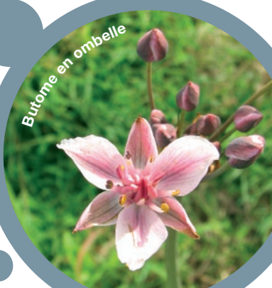
Bruyère en ombelle