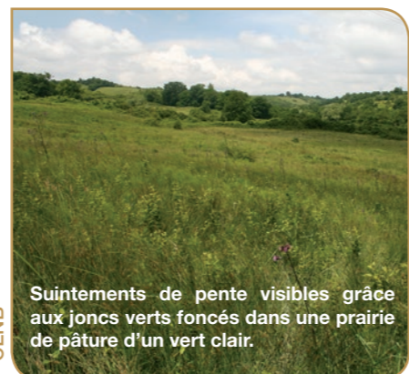
Suintements de pente visibles grâce aux joncs verts foncés dans une prairie de pâturage d'un vert clair.

Au sein des prairies sont installées des petites zones humides de suintements de pente en contexte agricole. Ponctuellement, se rencontrent des marais tufeux et zones paratourbeuses. Ce sont des milieux à forte patrimonialité qui accueillent des espèces comme le Scirpe comprimé, la Linaigrette à larges feuilles ou le Jonc noueux. Peu représentés sur le bassin versant de la Dheune, ces milieux sont très vulnérables et leur pérennité dépend du maintien du pâturage extensif.