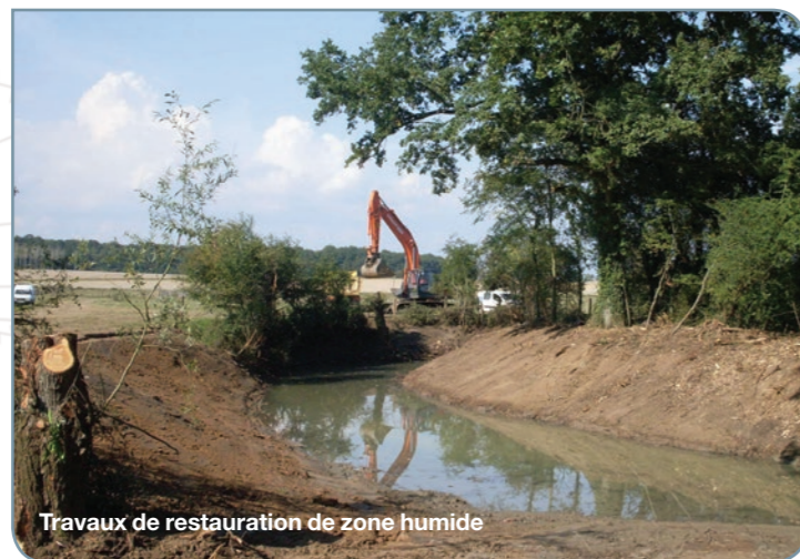
Travaux de restauration de zone humide

Cette opération concrétise la démarche partenariale engagée depuis 2008 entre l'EPTB Saône et Doubs, le Conservatoire d'espaces naturels de Bourgogne et les Fédérations de Pêche de Côte-d'Or et de Saône-et-Loire sur un état des lieux/diagnostic des zones humides de l'ensemble du bassin versant de la Dheune.