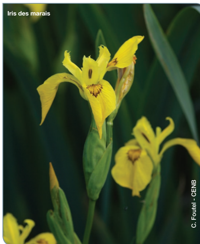
Iris des marais