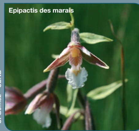
Epipactis des marais